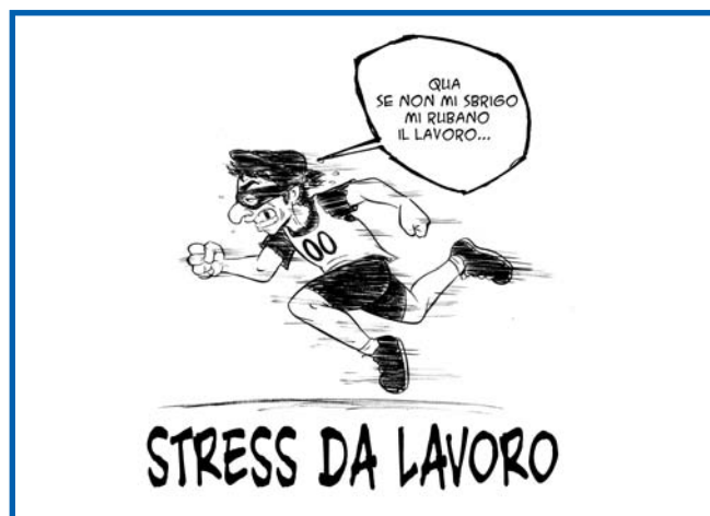
stress e velocità