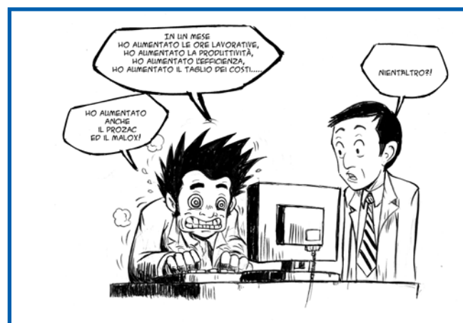
stress e carico di lavoro